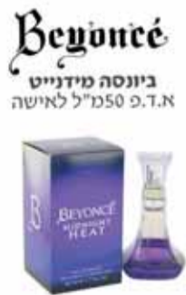
بيونسة ميدنيست 150 مل 150 مل