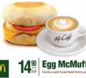
14.90 فقط! Egg McMuffin

شبكة مطاعم ماكدونالدز تطرح منتجاً جديداً في فروعها: ساندويش Egg McMuffin يحتوي ساندويش البيض، والذي تم ابتكاره في الستينات في الولايات المتحدة، على بيضة، جبنة صفراء وشرحة بندورة. ويعد وجبة صباحية خفيفة. ساندويش Egg McMuffin بإضافة قهوة كابوتشينو لوجبة فطور متكاملة الآن ب-14.90 ش.ج. فقط متوفر كل يوم حتى الساعة 13:00، في