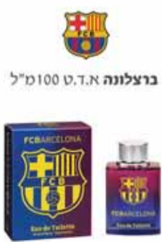
برצלونا 100 مل 100 مل

قبل الجريمة؟! تمنح المحكمة جائزة للقاتل المجرم، وهذا يؤكد أن هذا القاتل سيخرج ليقتل مرة أخرى". وأضاف زبيدات "علينا أن نقف وقفة واحدة ضد الاجرام وضد عصابات الاجرام وضد العملاء الذي زرعوا بيننا، لا أتمنى لأحد ان يذوق المرّ والمصيبة