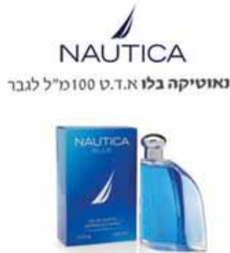
ناوتيكا 100 مل 100 مل