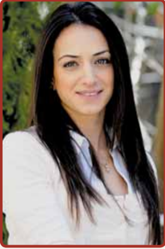
إعداد: نانسى نعمة

ثم قطعيه واغليه. قومي بتحليلته بالعسل الأسود واشربيه عدة مرات في اليوم. يمكنك تناول الجزر المسلوق أيضاً محلى بالعسل أو هرسه وتناوله كأنه مربى.