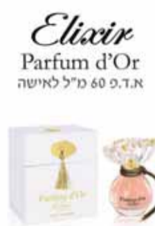
إليسير 60 مل 60 مل