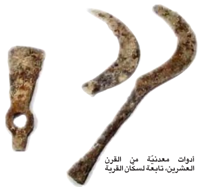
أدوات معدنية من القرن العشرين، تابعة لسكان القرية

أما الحفريات من العام 2000 فقد كشفت آثار كهوف من عصر البرونز الأوسط. تلك الكهوف احتوت على مكتشفات من الحياة اليومية، مثل: عظام كائنات حيّة، أدوات من الفخار، أدوات معدنية، وغيرها. كما يبدو فإن الكهوف هذه استعملت لاستخراج الحجارة الكلسية، وبعد أن تم الاستغناء عن الكهوف، تمّت تعبئتها بالتراب، وطمرها.