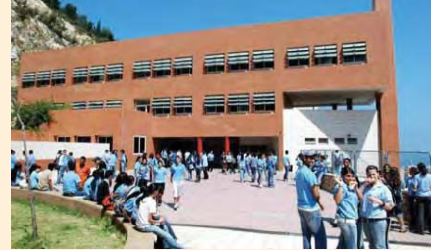
* صورة من الأرشيف لمدرسة المنتهي

لمراسل "حيفا" متطوع من خلال ساعاته الأسبوعية للطلاب , ما يتوافق مع مهاراته، كمساعدة مربيات الصفوف , والمساعدة في تشغيل مكتبة المدرسة، مساعدة الطلاب في تحضير واجباتهم المدرسية وحتى المساعدة في التحضير لامتحانات الثانوية العامة. وذكرت مديرة قسم التربية و القيم الاجتماعية في بلدية حيفا إيلانا تروك، بان المتطوعين المشاركين في برنامج تدريبي شامل يمنحهم الأدوات والمعرفة اللازمة للتعامل مع بيئة الطلاب . تعمل جمعية «صديق التربية»، بالتعاون مع قسم التربية و القيم الاجتماعية في بلدية حيفا ، منذ سنوات من أجل النهوض بموضوع المتطوعين البالغين في المدارس الحيفاوية وتعزيز العلاقات بين الجيل الناشئ والمتقاعدين في المدينة. ويتطوع في إطار الشراكة العشرية من المتقاعدين والمتقاعدين ، من بينهم مهندسين ومحاضرين ومفتشين الى جانب متطوعين من خارج قطاع التربية والتعليم . ويقدم كل