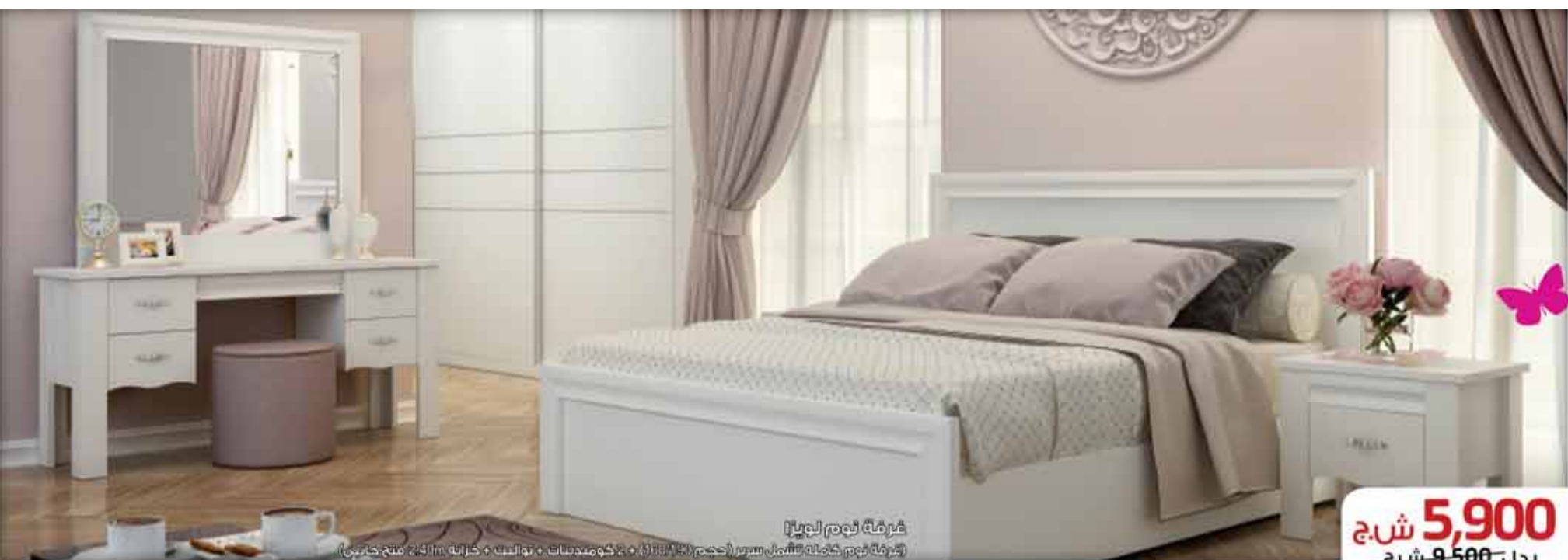
غرفة نوم لوزيا

(غرفة نوم كاملة تشمل سرير (حجم 130x200) + 2 كومودينات + تواليف + كرسيه 2411 مفتوح حائري)