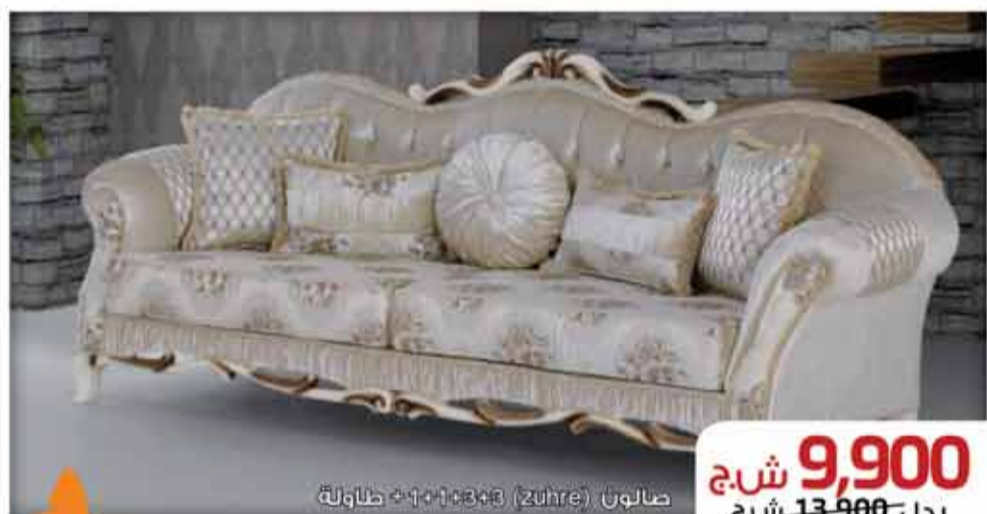
صالون (Zuhre) 1+1+3+3 + طاولة