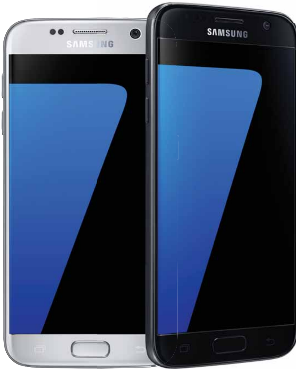
SAMSUNG Galaxy S7