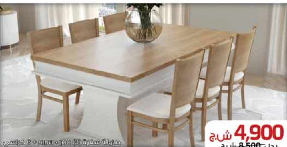
طاولة سفرة (3) بيلو + سم + 6 كرسي