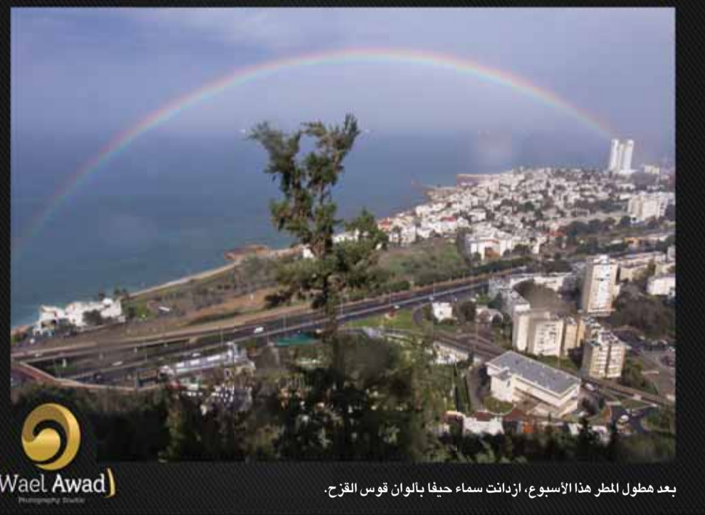
بعد هطول المطر هذا الأسبوع، ازدادت سماء حيفا بالوان قوس القزح.