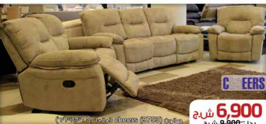
صالون (9753) cheers 1+2+3 (5 ريكليينج)