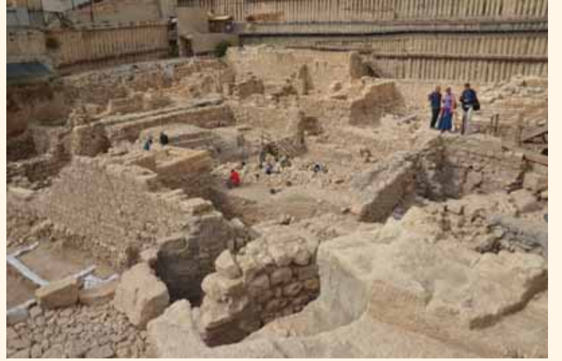
صورة عامة لمنطقة الحفريات.

نشرت سلطة الآثار هذا الأسبوع (الذي صادف خلاله يوم المرأة العالمي)، خبر العثور على ختم امرأة تاريخية يعود تاريخه إلى 2500 عام قبل أيامنا، خلال الحفريات الأثرية الجارية في منطقة سلوان (مدينة داود - 701 في القدس، الواقع ضمن المحمية الطبيعية حول أسوار القدس (سوب حوموت يروشليم) التي تديرها سلطة الحدائق الوطنية.