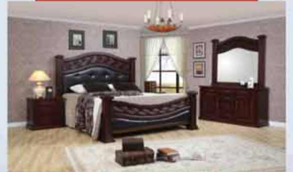
غرفة نوم ماليزيه