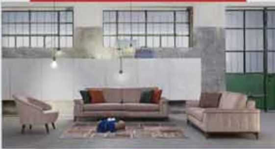
سوفت تركي 3-2-1-1