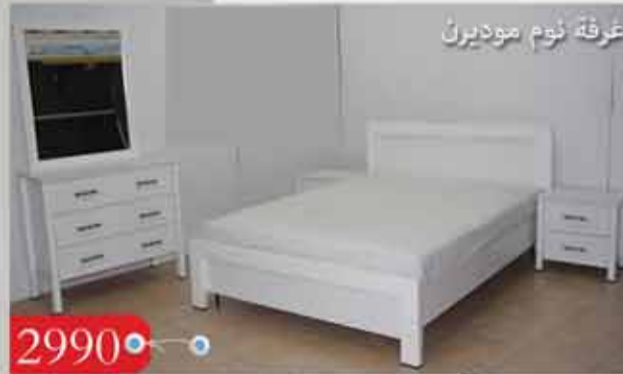
2990 • غرفة نوم موديرن