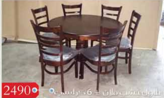
2490 • طاولة بيضت هالن + 6 كراسي