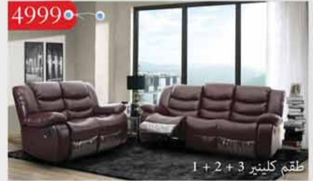
4999 • طقم كلينر 3 + 2 + 1