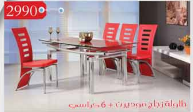
2990 • طاولة زجاج موديرن + 6 كراسي