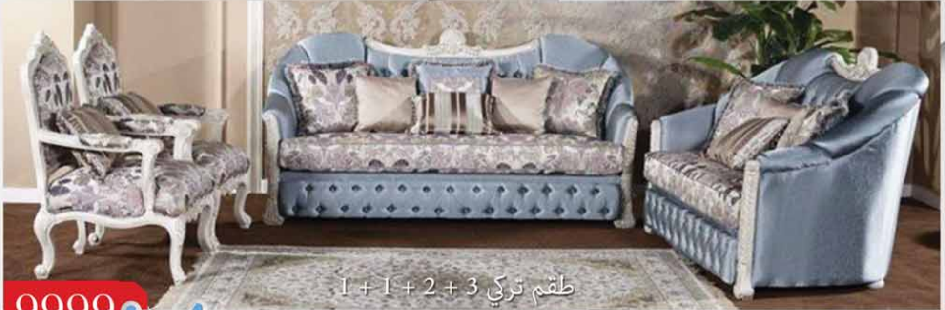
9999 • طقم تركي 3 + 2 + 1 + 1