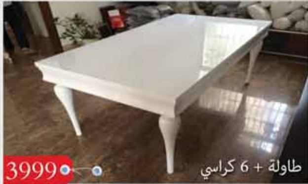
3999 • طاولة + 6 كراسي