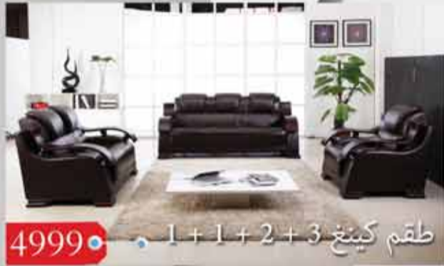
4999 • طقم كينغ 3 + 2 + 1 + 1