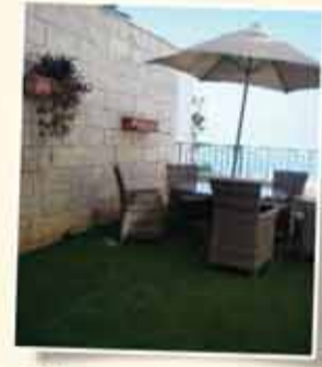
الكرمل الفرنسي 190م رفاية ومدوء، طابقين شرفة 70م من الصالون والفرفر مطلة لمنظر شمالي خلاب حديقة 40م + 3 مواقف [مسقوفة] خاصة + مصعد + مخزن - مبنى جديد 6 سكان فقط