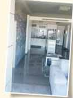
בועה 85 מן הרחמים הגלילה, מרמה בדוק רחם / מנظر شمالي خلاب + موقف خاص + شرفة 70م [سطح]