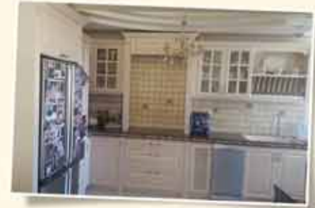
شاي عجنون 88م مرممة بدوق - منظر خلاب للطبيعة + مصعد + موقف