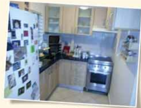
رمات متشبي شارع شونميت - 3 غرف - مع خرائط موافقة لبناء 38م إضافية من قبل البلدية + شرفة 35م ومنظر للوادي والبحر