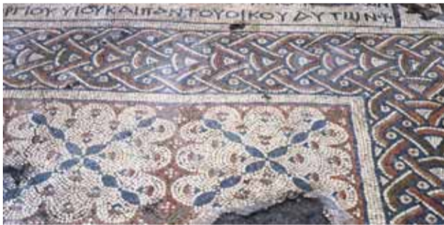
الفسيفساء في «قصر العاشق»

شك أنها واحدة من اللحظات التي نطرح فيها التساؤلات حول مواقع التراث ومصيرها، ومدى أهميتها بالنسبة لنا؟! مع صدور العدد الأول من صحيفة «حيفا»، أتيت لنا الفرصة والمنصة لعرض للقرء الأعزء، وبشكل مستمر، لمحة عن مواقع التراث وآثار الحضارات التي سكنت بلادنا واستوطنتها عبر التاريخ. وما كنا نحاول نشره من خلال تلك المقالات، هو إضافة لقيمة تلك المواقع الأثرية، لهدف دراسة ومعرفة ماضي بلادنا وتاريخنا العريق فيها. فالأمر لا يقتصر فقط على قانون يصر بمنع سرقة الآثار، بل هو ما تعنيه تلك الآثار لنا من قيم أخلاقية وحضارية، ومدى حبنا لتراثنا وتاريخنا، وقلقنا عليه واهتمامنا به، لا بل مدى احترامنا لجميع الحضارات التي سكنت هذه البلاد وساهمت في بناء هذا التاريخ. نحن على أمل، أن نساهم من خلال تلك الأسطر القليلة والتي تنشر أسبوعياً عبر صحيفة «حيفا» الغراء، بزيادة الوعي الثقافي لأهمية تلك المواقع، وأن تحفز المتبرعين والنشيطين في مجتمعنا، للمساهمة في الحفاظ على تلك الآثار من أجل الأجيال القادمة. «شعب لا يحترم ماضيه، حاضره فارغ ومستقبله غامض» (مقولة عن يجنال ألون - واحدة من المقولات التي تفتبس في تدريس التاريخ والآثار).. تذكروا ذلك!