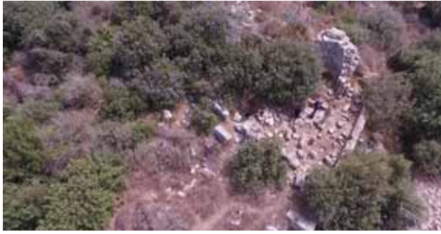
صورة من الجو لموقع الكنيسة الأثرية في «قصر العاشق» والفسيفساء المسروقة والأعمدة التي أسقطت أرضاً.

د. كميل ساري (مدير قسم الرقابة، الأبحاث وصيانة الآثار)