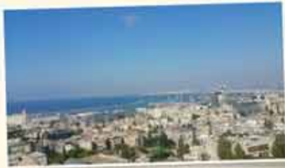
بيت في حيفا - 85م 3 غرف طابق 2 وأخيرة + موقف خاص - مرمة حديثاً