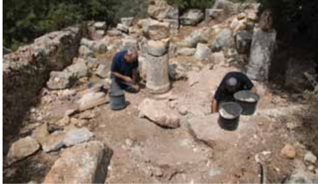
أثريو سلطة الآثار يجمعون قطع الفسيفساء المبعثرة في الموقع.

اعتقل رجال الشرطة، هذا الأسبوع، شابين مشتبهين بأعمال تخريب وسرقة آثار كنيسة يعود تاريخها إلى الفترة البيزنطية، والمتواجدة في الموقع الأثري «قصر العاشق». وقد تم اعتقال الشابين (في العشرينيات من العمر من قرية كسرى) صدفة، إذ طارد رجال الشرطة سيارة مشبوهة، ويعد أن أمر الشرطي سائق السيارة بالتوقف وتم تفتيشها، كانت المفاجأة كبرى، إذ وجد رجال الشرطة داخلها قطعاً من الفسيفساء، عليها كتابة باللغة اليونانية. وبعد فحص تبين أن الأرضية اقتلعت من الكنيسة البيزنطية الموجودة في «قصر العاشق» (التي كنا قد نشرنا عنها تقريراً مفصلاً في العدد 284 من صحيفة «حيفا» - 14-08-2015). إضافة إلى اقتلاع الفسيفساء، فقد قام اللسان بأعمال تخريبية في الكنيسة ذاتها، كان من بينها إسقاط الأعمدة إلى الأرض وتكسيروها! هذا وتم تمديد اعتقال المشتبه بهما حتى الانتهاء من التحقيق معهما، حيث تطالب سلطة الآثار بأن ينالا أقصى العقوبة التي يصر عليها قانون الآثار، وهي السجن الفعلي لمدة خمس سنوات. وماذا بعد؟! تعتبر عملية التخريب هذه في «قصر العاشق»، واحدة من أفظع أعمال التدمير والنهب لموقع أثري في منطقة الجليل خلال السنوات الأخيرة. ولا