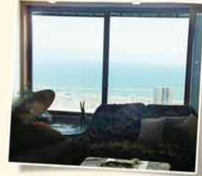
مشمونليم: 5 غرف مرمة - منظر خلاب للبحر 145م + شرفة + موقف + مصعد