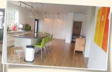
رماث هتشيبي - 168م 5 غرف مرمة + منظر مفتوح وواسع + شرفة وحديقة