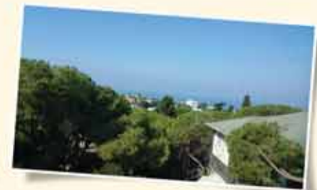
رماث هتشيبي - 108م 4 غرف مرمة + منظر خلاب + شرفة [سطح] 70م - بناية حجر