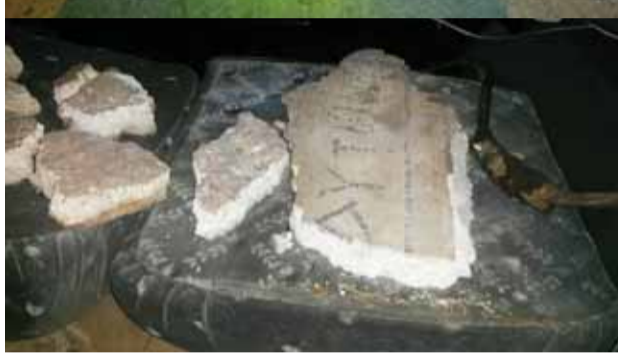
الأعمال التخريبية - أرضيات الفسيفساء التي تم الكشف عنها داخل السيارة المشبوهة.