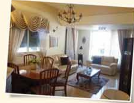
الحي الألماني - هجيفن: 88م بموقع مركزي 4 غرف طابق 1 مرمة بالكامل وبذوق رفيم