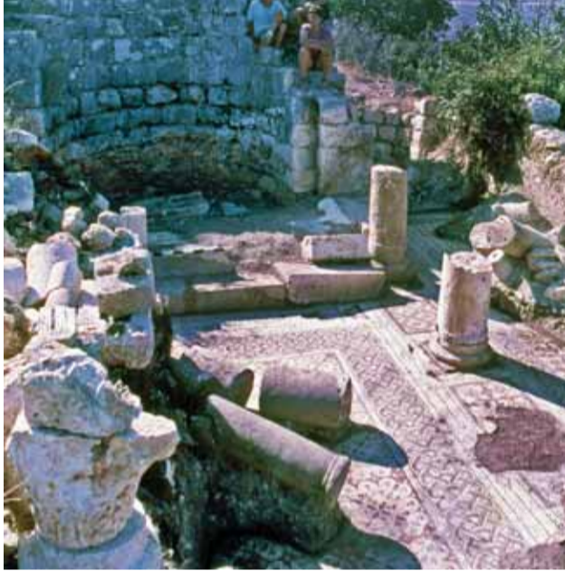
صورة عامة للموقع بعد الحفريات، تصوير: د. موطي أفيعام، معهد «كينرت» لآثار الجليل.