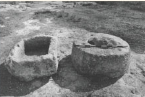
بئر لماء والحوض إلى قرية.

أشارت نتائج البحث/المسح الأثري عن وجود بداية استيطان خلال الفترة البيزنطية، وذلك استناداً لأدوات الفخار فقط، إذ لم تجر التنقيبات داخل القرية الحالية. إلى الجنوب من منازل القرية الحالية، وعلى مقربة من «وادي الكواشين»، تم العثور على ستة كهوف على المنحدر ما بين يركا والوادي. جميع هذه الكهوف منحوتة في الصخر الجيري الطري، ومن المرجح أنها كانت تستعمل لاستخراج الكلس الذي استعمل في البناء، بدلاً من الإسمنت المعاصر في أيامنا.