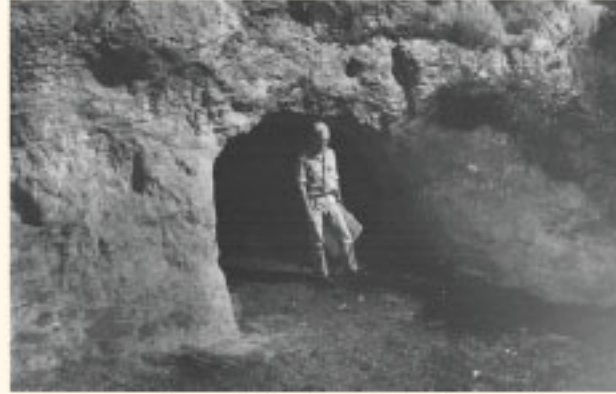
مدخل احد الكهوف على مقربة من يركا.

كما أسلفت الذكر، فإن الأبحاث الأثرية في هذه المنطقة قليلة جداً. ذكر الرحالة فكتور جيرن جولس عام 1880، حيث وصف آبار مياهها وحجارة بنائها القديم المنتشر في أنحاء القرية.