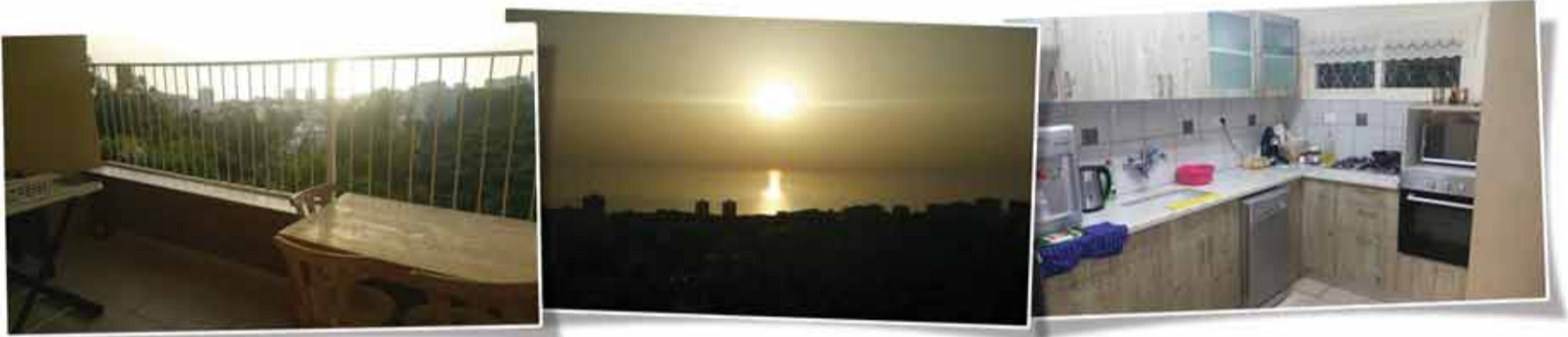
الكرمل الفرنسي - بيت ليحم 110م 4 غرف، مرمتة - طابق 1 ومنظر للبحر