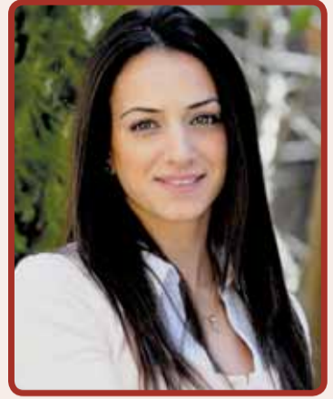
إعداد: نالسي نعمه

لا علاقة لتقليل الوزن بالامتناع عن تلبية دعوات الأصدقاء لحفل أو غداء أو عشاء! إن الحمية وخسارة الوزن الزائد لا تعنيان الامتناع عن الأكل لساعات طويلة! إن الحمية الصحية تعني القيام باختيار الطعام الصحي والصحي، والاعتدال في كميات الطعام، كأساس نجاحها.