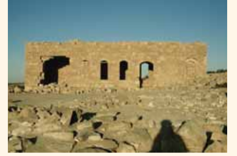
واحد من المنازل في «حالوتسا».

استعرض في هذا المقال لمحة عن الموقع الأثري «حالوتسا» وأهم نتائج الحفريات، ذلك تبعاً للمقال من العدد السابق الذي نشرنا فيه خبر العثور المميز عن بذور العنب، التي يعود تاريخها إلى الفترة البيزنطية.