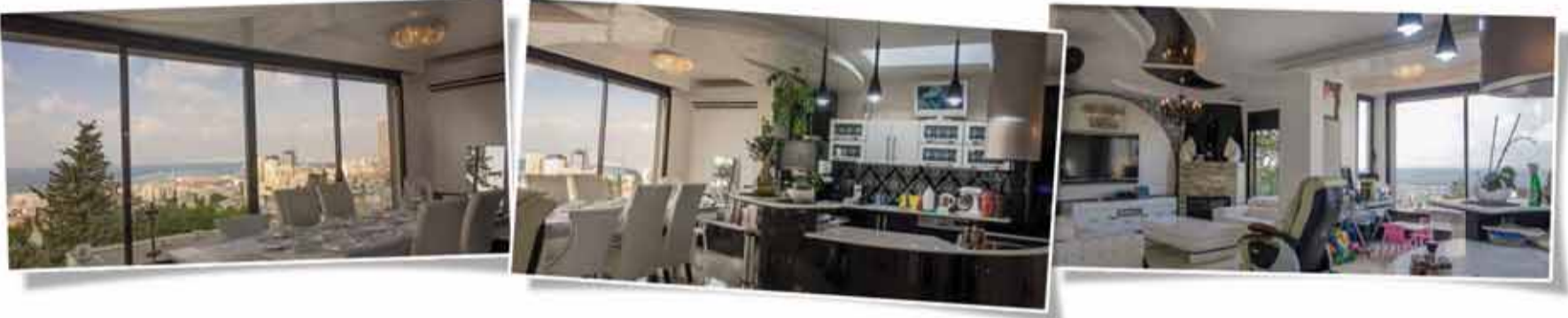
بيت شعاريم - 120م - 4 غرف طابق 3 مرمتة وجميلة جداً، منظر خلاب ومفتوح للبحر حمامان، مخزن + موافقة لبناء 7"م + شرفة

بيع, شراء, تأجير وإدارة جميع أنواع العقارات بإدارة: روجيه ضاهر