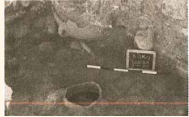
صورة خلال الحفريات عام 1975 - جزء من المخزن

قبل البدء بالتنقيبات الأثرية لم يكن معروف لنا الكثير عن سعسع الأثرية والتاريخية، سوى القليل من الأبقاض التي كانت بارزة على سطح الأرض، مثل: آثار الكنيس وجزء من قلعة تاريخها القرن الثامن عشر. المصادر التاريخية التي ذكرت سعسع قليلة جداً، كذلك هنالك بعض الشكوك حول مهيمنة ودقة البعض من تلك المصادر.