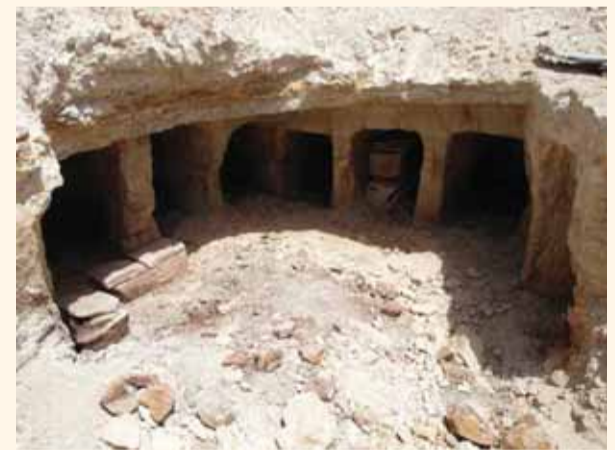
صورة للكهف من الحفريات عام 2013

جرت الحفريات الأولى عام 1968 واستمرت على فترات حتى العام 2014. أشارت نتائجها إلى بداية الإستييطان منذ الفترة الكنعانية الوسطى (2000 - 1550 ق.م) إستمراراً حتى أيامنا هذه. من بين أبرز المكتشفات لتلك الحفريات آثار كنيس من الفترة البيزنطية