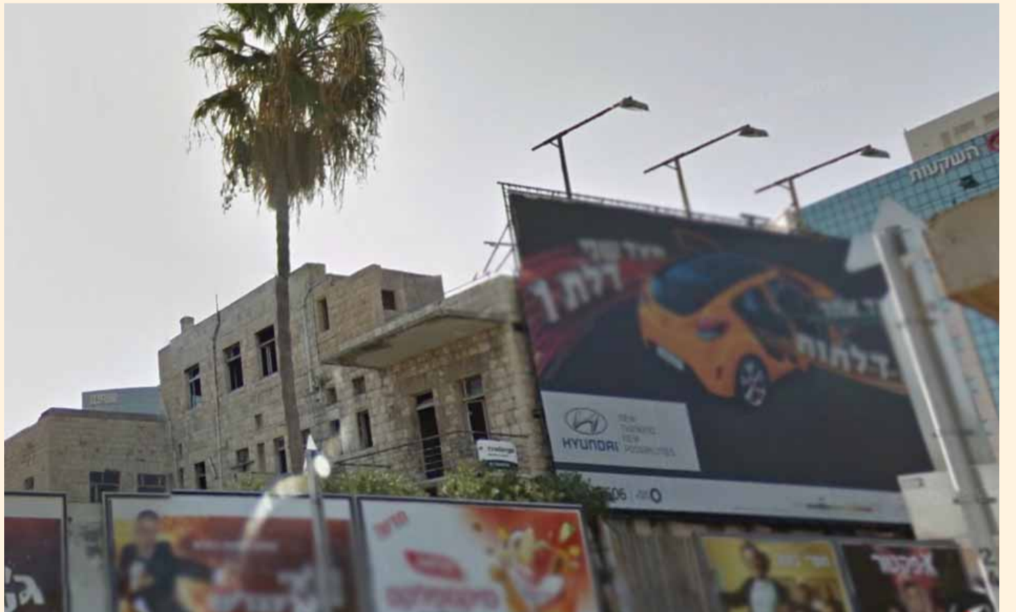
مبنى عائلة بوتاجي بلطف عن