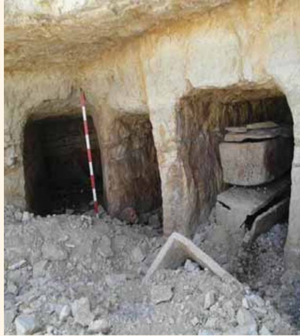
صورة مدخل أحد الكهوف خلال الحفريات من العام 2004

إلى مخزن للحبوب كبير الحجم، يعود إلى بداية العصر الحديدي. أما التنقيبات من العام 1976، كشفت عن بقايا قبر من الفترة الكنعانية الوسطى، والذي تضرر جزءاً منه جراء أعمال البناء بالموقع. لذا لم يكن بالإمكان الكشف عن القبر بكامل مبناه. القبر عبارة عن كهف نحت بالصخر المحلي، احتوى على ثلاثة عشر هيكلًا عظيمًا دفنت داخل القبر على فترات عديدة خلال الفترة الكنعانية.