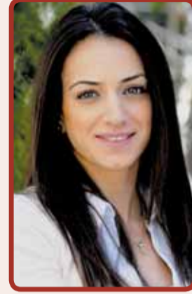
إعداد: نانسي نعمة

هل تعلمين أن نسوع ما تأكلينه وكميته يؤثران على خصوبتك؟! فالغذاء يرتبط بالخصوبة بالنسبة للرجل والمرأة، لذلك إذا اتخذت قرار الحمل وتريدين معرفة ما يساعدك لزيادة فرصة الاخصاب ونجاح الحمل، فسأحدثك عن الأغذية الأكثر أهمية لتعزيز فرصتك في الحمل وإنجاب طفل بصحة جيّدة، وعن الأغذية التي يجب عليك تجنّبها. ماذا عليك أن تأكلي لزيادة فرصة حملك؟