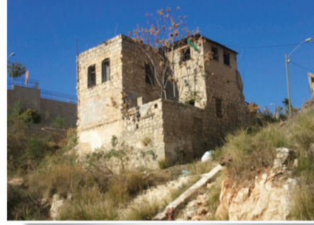
وادي الصليب بناية منفردة وخاصة في الحي