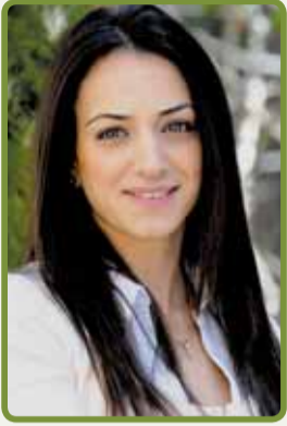
إعداد: نالسي نعمة

الانتفاخ هو الذي يسمى الريح أو تطبل البطن، ومن أعراضه: المغص الذي لا يزول إلا بعد إطلاق الغازات المعوية وخروجها من فتحة الشرج. وأهم أسباب الانتفاخ هو الهواء الذي يتم ابتلاعه، أو تناول الوجبات الغنية بالألياف أو البقوليات، أو فيروس يصيب الجهاز الهضمي أو التخمر، وتنتج معظم الغازات في الأمعاء بسبب النشويات غير المهضومة، والأمعاء لا تفرز الإنزيمات الضرورية لهضم النشويات، وإنما يتم ذلك في المعدة. الوقاية من الانتفاخ بتناول الوجبات المتوازنة مع الابتعاد عن القلق والتوتر، كما يمكنك معادلة الغازات ببعض المركبات،