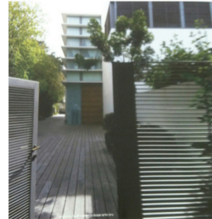
فيلا في الكرمل - مبنى 700 م على مساحة 1200م مصممة بمستوى عال + بركة سباحة