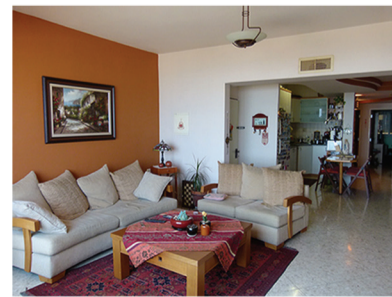
عبّاس - جميل شلهوب 4.5 غرف - 115م + حمامان. مرممة. شرفة + مصعد + موقف + مخزن. منظر للبحر