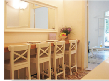
زقاق الكروم - بمحاذاة حديقة البهائية طابق أرضي 55 م + حديقة 70 م - مرممة بذوق مؤجرة بـ 3,500 ₪