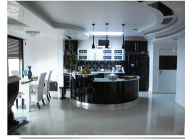
بيت شعاريم 120م - 4 غرف طابق 3 مرممة وجميلة جداً، منظر خلّاب ومفتوح للبحر حمامان، مخزن + موافقة لبناء 7"م + شرفة 1,200,000 ₪