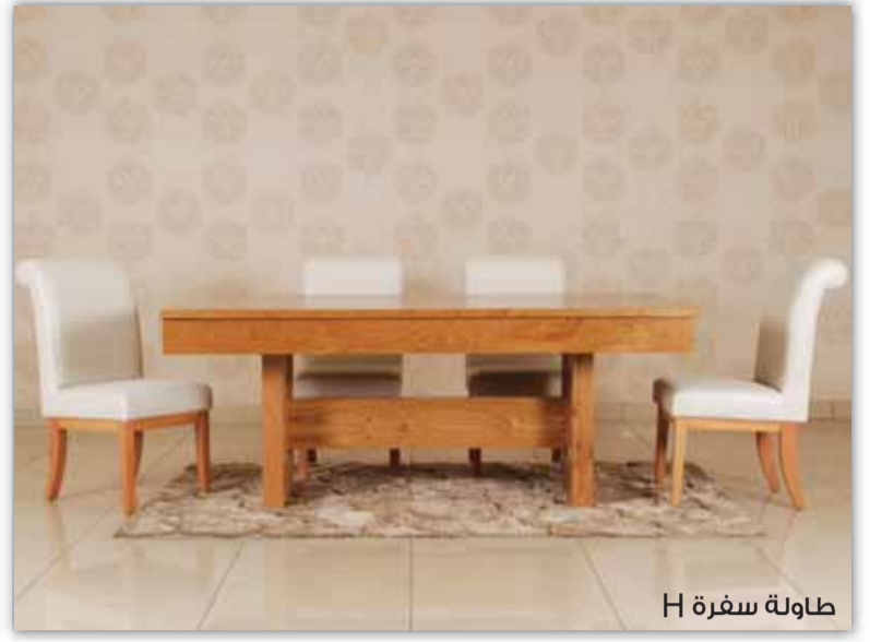
طاولة سفرة H