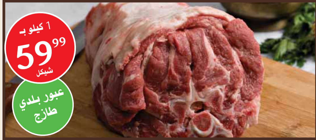
رقاب عبور للحشي