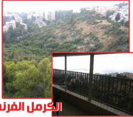
الكرمل الفرنسي - بيت لحم 110م 4 غرف طابق 2 + تترفة, منظر مفتوح للبحر