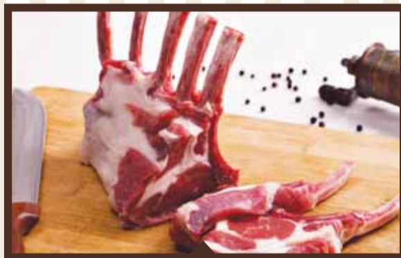
1 كيلو اضلاع عبور ملوكية 89 99 شيكل