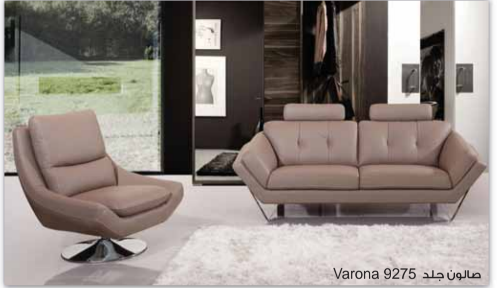
صالون جلد Varona 9275