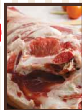
1 كيلو لحمة عجل + خروف للطحن 59 99 شيكل