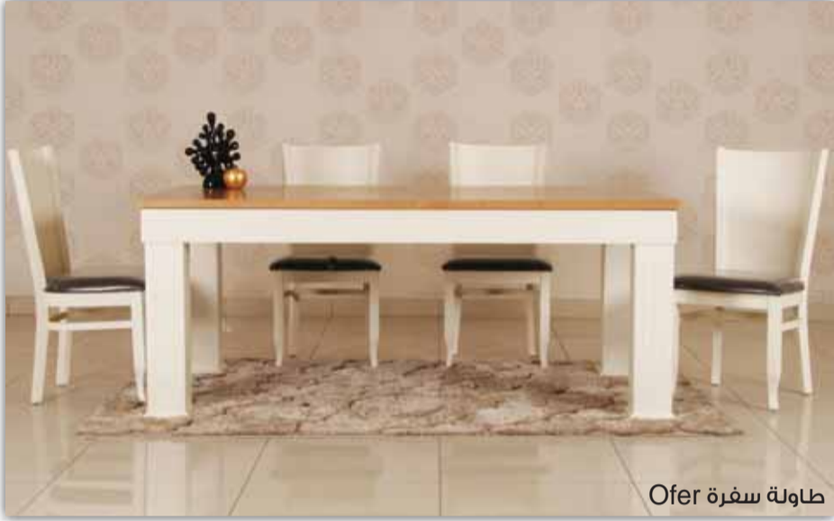
طاولة سفرة Ofer