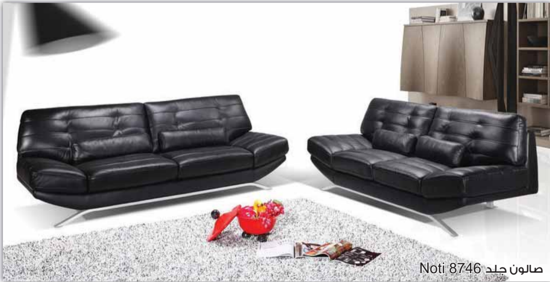
صالون جلد Noti 8746