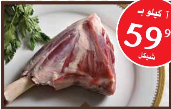
1 كيلو موز خروف 59 99 شيكل