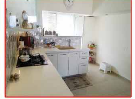
ستيلاماريس - مرممة حديثاً 88م 4 غرف طابق 2, منظر للبحر