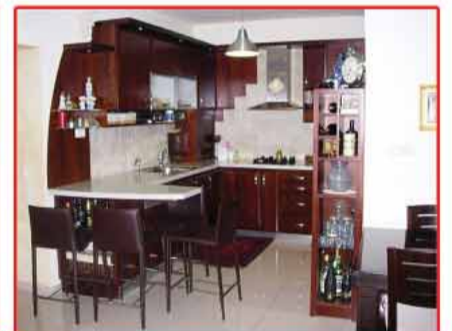
"تلنايم بنوفمبر" - 115م 4 غرف مرممة منظر للبحر