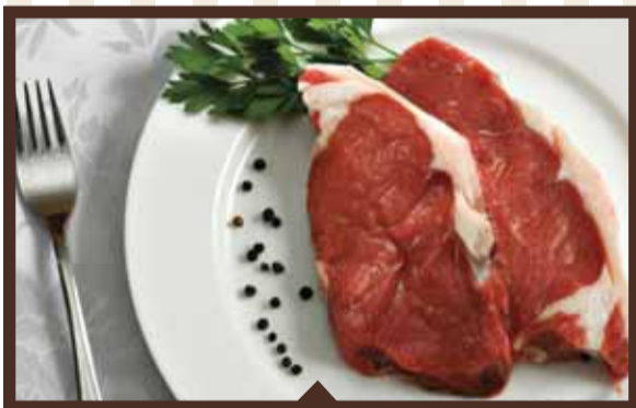
1 كيلو ستيك سينتا للشوي 89 99 شيكل