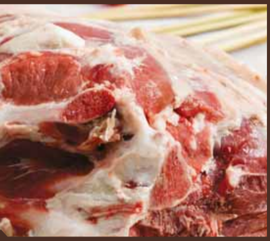
فخذة عبور ص