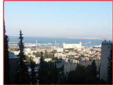
بينتوف حجار - المبنى الجديد 3.غ. ط. 2 + تترفة + موقف + مصعد, منظر مفتوح للبحر