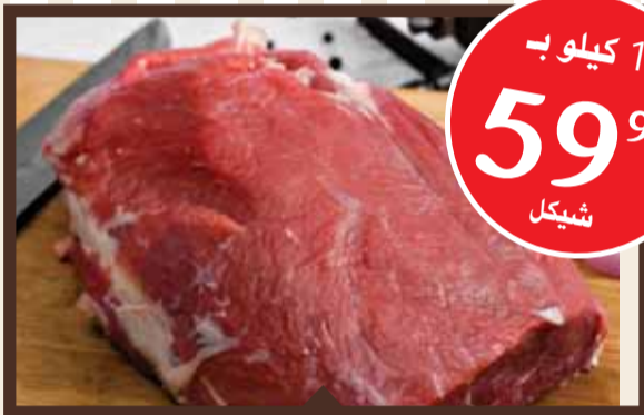
1 كيلو لحمة عجل أحمر 59 99 شيكل