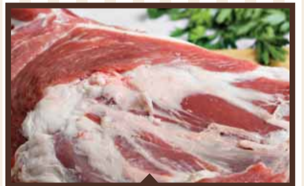
1 كيلو لحمة خروف بدون عظم 89 99 شيكل