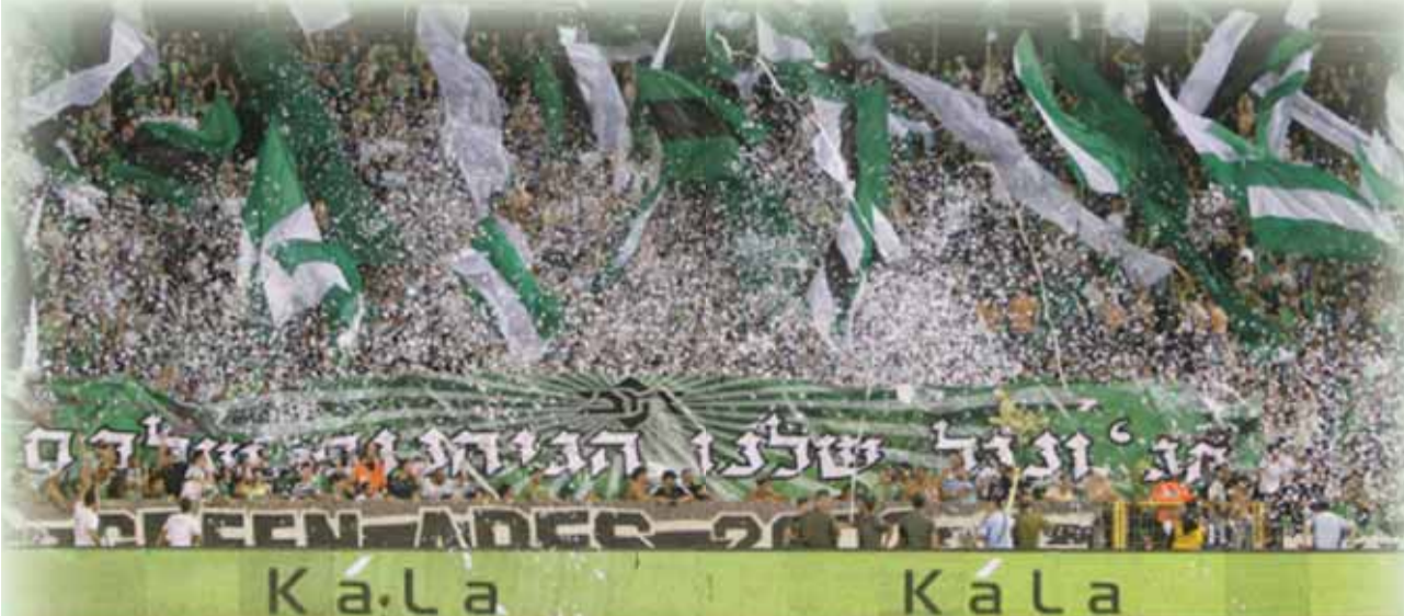
جمهور مكابي حيفا في عرض كرنفالي

وذكر أن بيريز نقل هذا الأمر إلى كل من قائد «ريال مدريد» وحارس مرماه، الكاپيتان إيكركاسياس، والمدافع سرخيو راموس. وتم الكشف عن هذا الأمر، خلال اجتماع غير رسمي، عقد خلال الأسبوع المنصرم، في أحد مطاعم مدريد، لهدف إعلام اللاعبين بسياسة المكافآت التي يتبعها النادي، لهدف تحفيزهم على تحقيق اللقب الأهم على صعيد الأندية الأوروبية. وتعد مكافأة البطولة الأوروبية لهذا الموسم، أكبر من تلك التي حذتها «ريال مدريد» في الموسم الماضي، والتي بلغت 360 ألف يورو لكل لاعب؛ إلا أنه أقصى الفريق المديردي على يد الوصيف «بايرن ميونيخ» في دور نصف النهائي. من الجدير ذكره، أنه في المرة الأخيرة التي فاز فيها «ريال مدريد» في بطولة أوروبا، كانت عام 2002؛ في حين نجح بالفوز باللقب من جديد، فستكون هذه المرة العاشرة في تاريخه.. لنتظر ونرى هل سينجح مورينيو وتلاميذه بالتغلب أولاً على «مانشستر يونايتد» في دور الـ16 والارتقاء إلى المراحل المتقدمة، قبل أن يفكروا في الفوز بالبطولة.