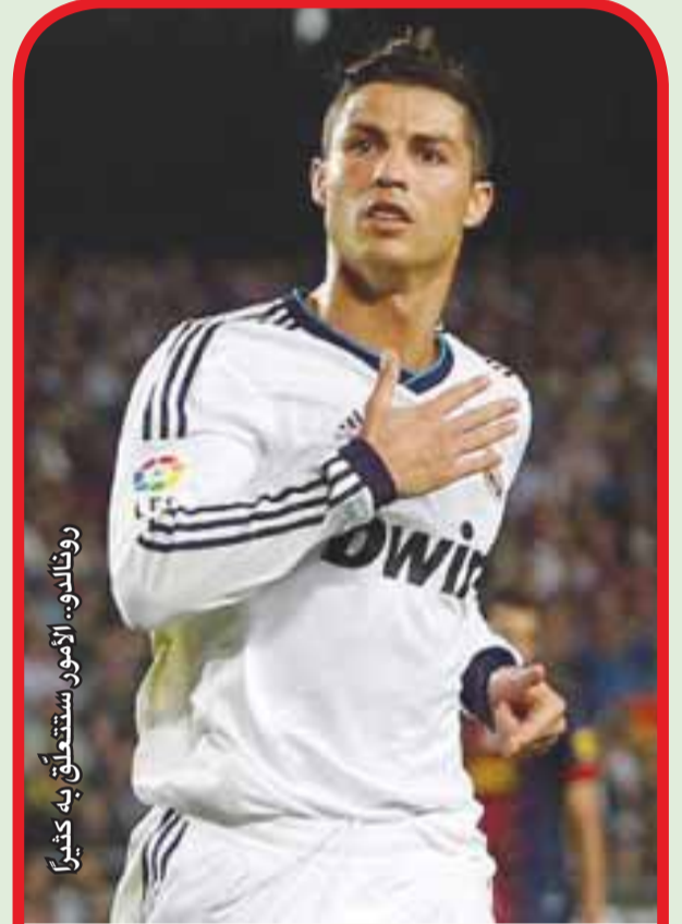
رونالدو، الأمور ستتعلق به كثيراً

بفارق هدفين أو أكثر! منذ أول أمس الأربعاء، تم بيع جميع البطاقات لمشجعي مكابي حيفا وتل أبيب، والتوقعات أن يتواجد في المدرجات 16 ألف متفرج، على الأقل. أما بالنسبة للفريق الحيفاوي الأحمر، فلقد حقق فوزاً هاماً في الأسبوع السابق (2-0 على رמת هشارون)، ليحصل على 7 نقاط متتالية في المباريات الثلاث الأخيرة، وليصبح رصيده 17 نقطة، وهو يبتعد الآن بفارق نقطة واحدة فقط عن هيوغويل رמת غان، فوق الخط الأحمر، وسيواجه يوم الأحد القريب في عاصمة النقب، هيوغويل بئر السبع، أملاً أن يتابع نجاحاته من الفترة الأخيرة والتقدم في اللاتحة.