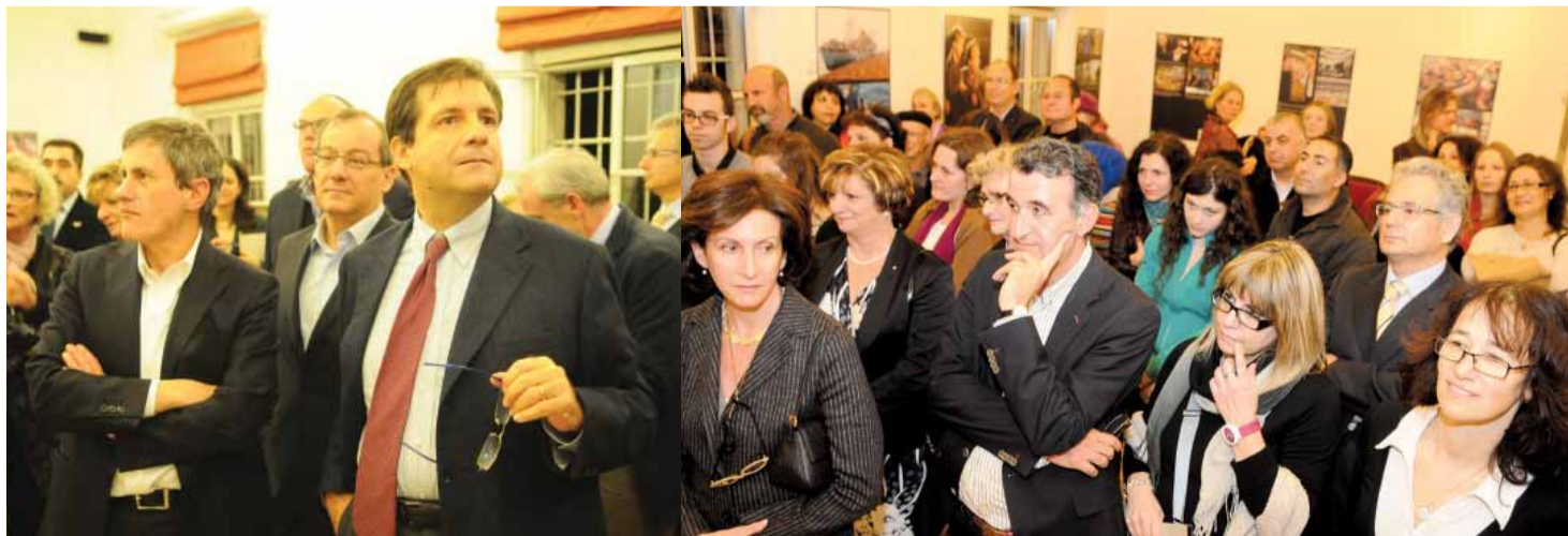
(من اليمين) السفير الإيطالي وإلى جانبه رئيس بلدية روما

كما يقدم المعهد مساعدات ودعمًا لعدد من المؤسسات الفنية والثقافية في إسرائيل، مثل صالة العرض ومتحف أم الفحم، إلى جانب مشاركة أفلام إيطالية في مهرجان الأفلام الدولي في حيفا، الذي يقام في عيد العرش من كل عام.