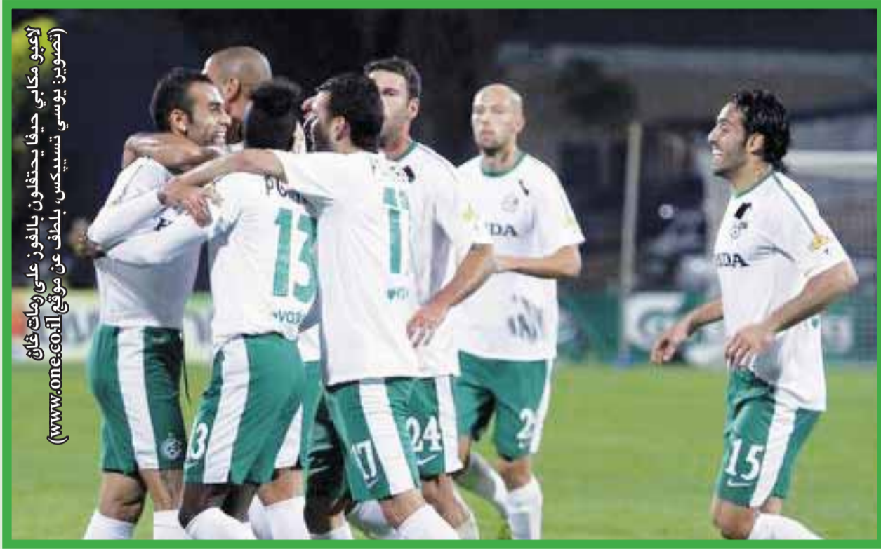
لاعبو مكابي حيفا يحتفلون بالفوز على رמת غان