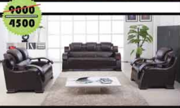
صالون تركي 3+2+1+1