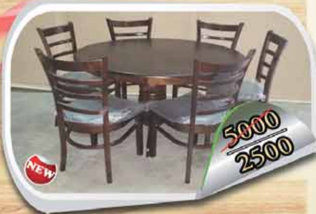
طاولة + 6 كراسي خشب ملان