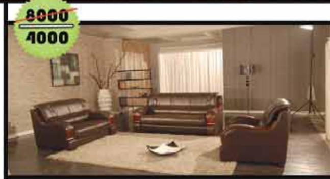
صالون تركي 3+2+1+1