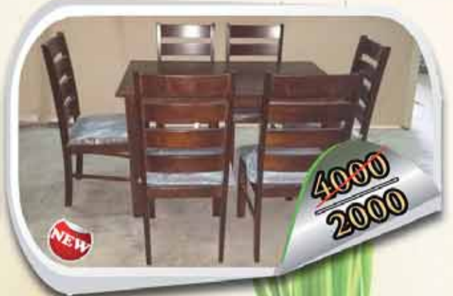
طاولة + 6 كراسي خشب ملان