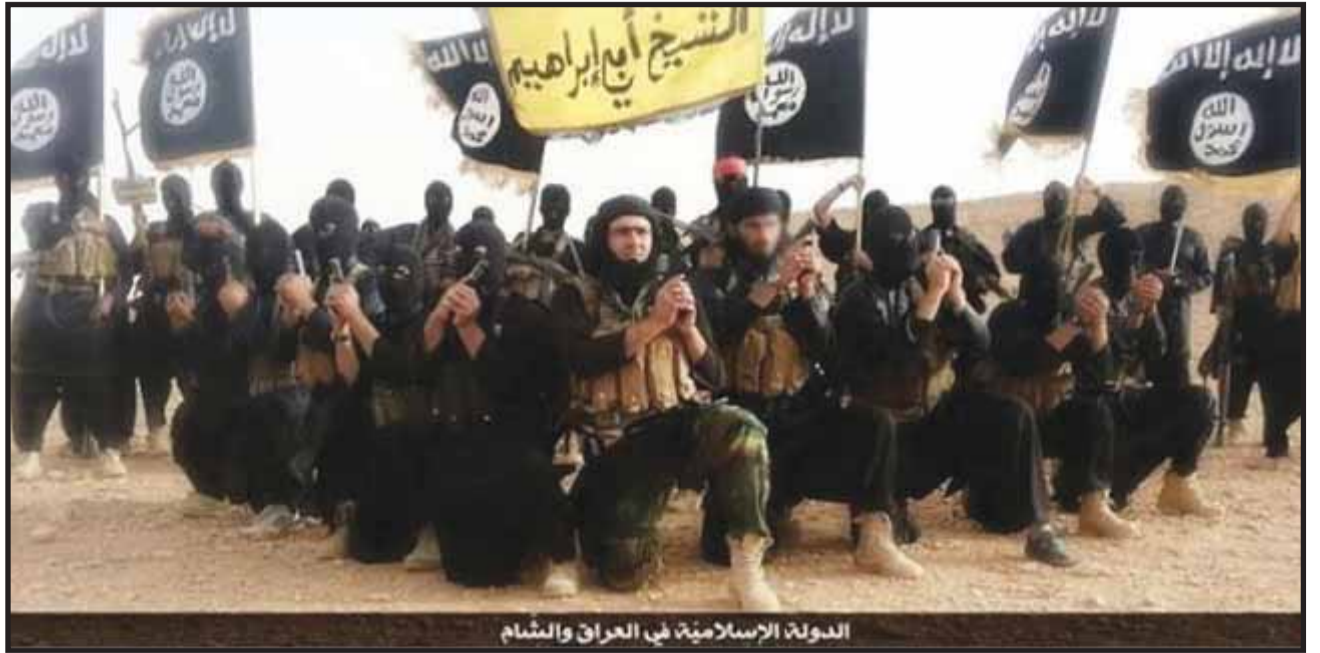
الدولة الإسلامية في العراق والشام