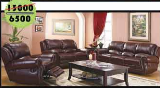
صالون اشلي امريكي 3+2+1