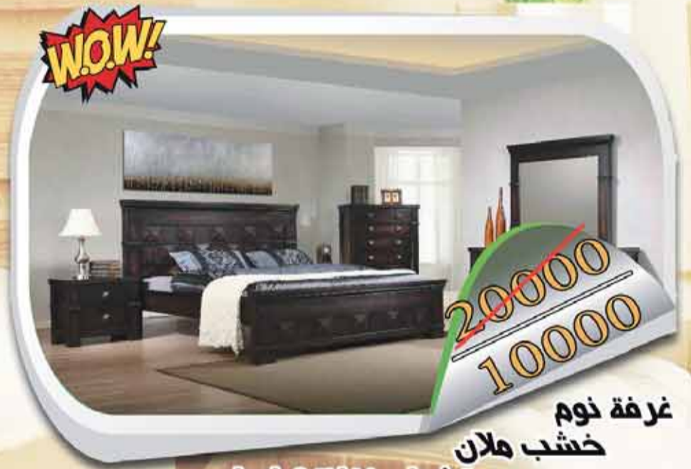
غرفة نوم خشب ملان تشمل خزائنة 6 ابواب