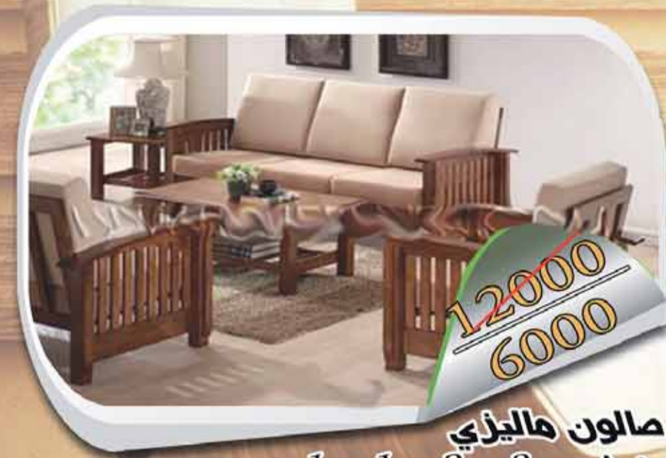
صالون ماليزي خشب 1 + 1 + 2 + 3