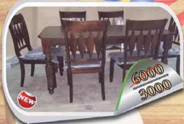
طاولة + 6 كراسي خشب ملان