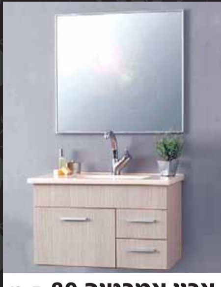
ארון אמבטיה 80 ס"מ ארון תלייה