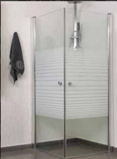
مقلحون פינתי 2 دלתות