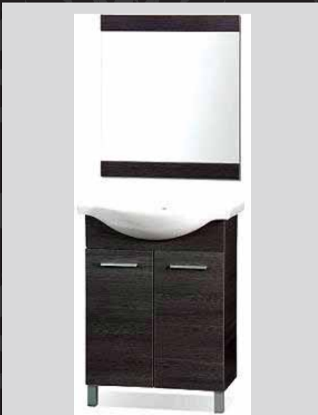
ארון אמבטיה 65 ס"מ