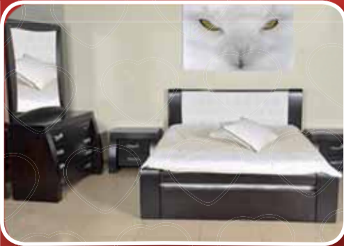
غرفة نوم كاملة + خزانة 4 ابواب