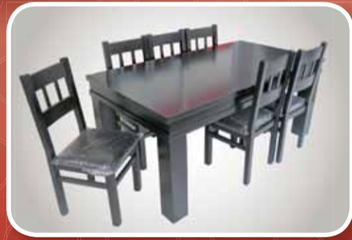
طاولة سفرة + 6 كراسي

سرير وفرشة. خزانة 4 ابواب. 2 كمودينات تواليت ومراة طقم صالون 3+2+1 مع طاولة صالون. مزنون وفترينة طاولة سفرة مع 6 كراسي.