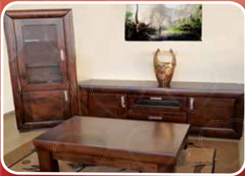
مزنون + فترينا + طاولة

سرير وفرشة. خزانة 4 ابواب. 2 كمودينات تواليت ومراة طقم صالون 3+2+1 مع طاولة صالون. مزنون وفترينة طاولة سفرة مع 6 كراسي.