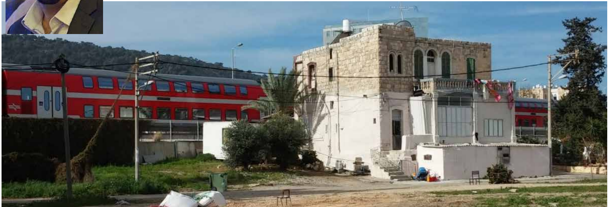
سكة القطاري في الحي. قيمة العقارات ستتضاعف عند فتح واجهة البحر وترسيب سكة القطار