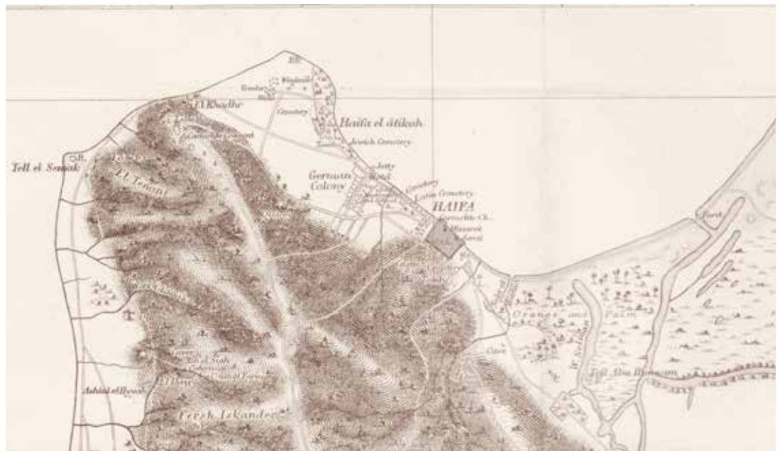
خارطة لمدينة حيفا من العام 1875 ويظهر في وسطها اسم «حيفا العتيقة»