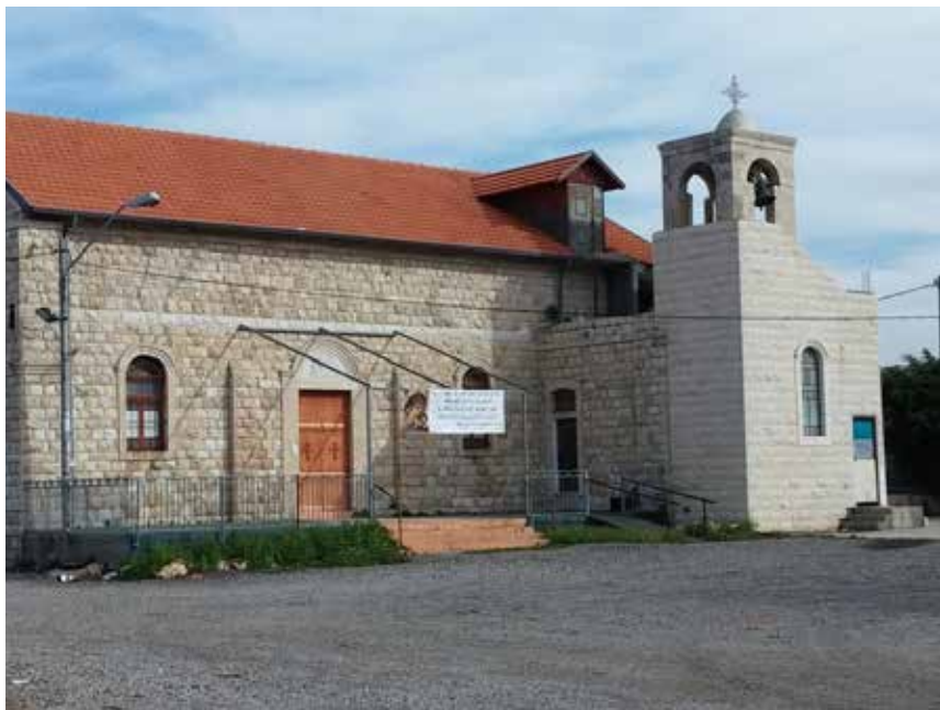
كنيسة الملاك جبرائيل: شاهدة على تاريخ الحي في وجه التزييف