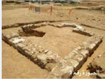
الصورة رقم 1

وفقاً لما قاله شاعر تصور والدكتور يوحنا (جون) زليج مان، مديراً الحفريات من قبل سلطة الآثار: "إنه جامع قروي – محلي من تلك الفترة، يُعتبر مكتشفاً أثرياً نادراً جداً في الشرق الأوسط والعالم بأسره، وخاصة في المنطقة المتواجدة إلى الشمال من بئر السبع، حيث لم يتم العثور في هذه المنطقة حتى الآن، على مبنى مشابه له. نحن نعلم عن وجود جوامع كبيرة خلال تلك الفترة في القدس ومكة، إلا أنه في هذه الحالة لدينا مصلح صغير كان باستعمال المزارعين من المنطقة. ما وجدناه، بقايا مسجد مفتوح تحت السماء – مبنى مستطيل الشكل له ساحة داخلية، محراب تجاهه إلى الجنوب – إلى مكة. تلك المؤشرات تدل على استعمال المبنى قبل مئات السنوات". كذلك، تم العثور خلال الحفريات على مبنى تاريخه من الفترة البيزنطية (القرون 6-7 ميلادي)، وبقايا استيطان تاريخه الفترة الإسلامية (القرون 7-8 ميلادي)، منه تبقت آثار المنازل التي كانت مقسمة إلى غرف صغيرة، تشمل