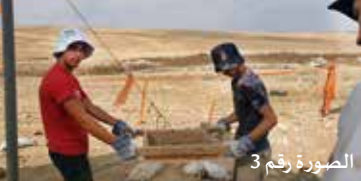
الصورة رقم 3

خلال هذه الأيام، تحاول سلطة الآثار والسلطة لتطوير وإسكان البدو في النقب، بحث السبل التي تمكن من الحفاظ على الجامع ودمجه ضمن الحي السكني الجديد ليكون متاحاً للجمهور.