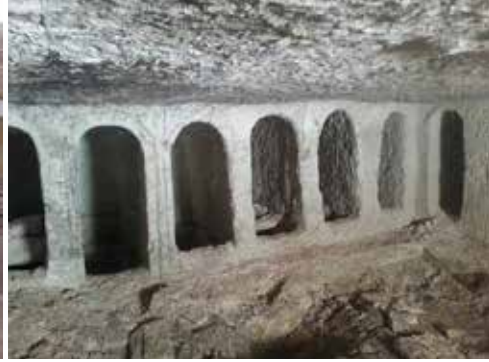
الصورة رقم 3