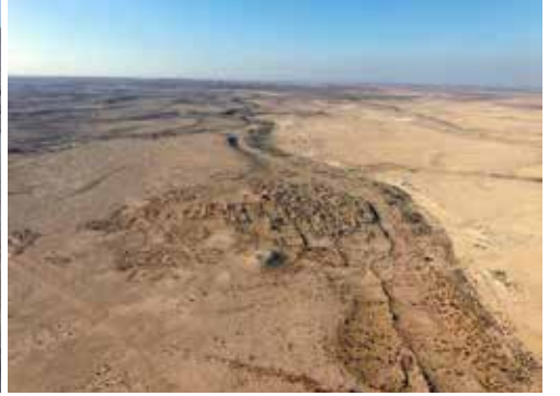
الصورة رقم 1

(الصورة رقم 3 - المغرة من الداخل والأكوخ المنحوتة لوضع النواويس). أما الحفريات الأثرية الثانية فقد أُجريت في الكنيسة الجنوبية - الغربية في الموقع، والتي تم تحديد تاريخها إلى الفترة البيزنطية (الصورة رقم 4 - المشكاة في القاعة الرئيسية في الكنيسة).