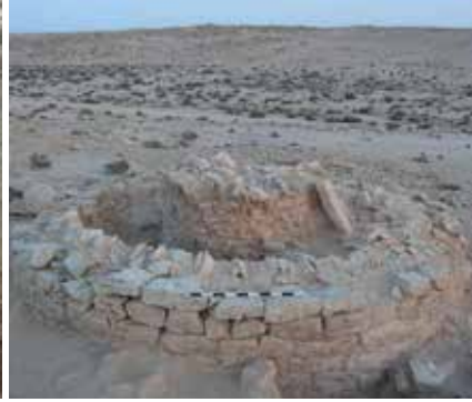
الصورة رقم 2