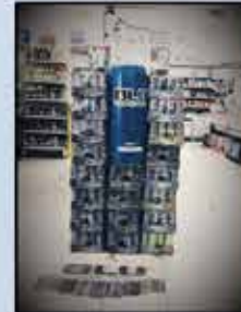
مخير أبو يوسف الناصرة