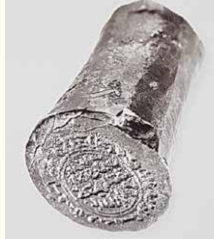
الصورة رقم 2: مجموعة من العملات الأيوبية والأموية معروضة في متحف إسرائيل.

العديد من مجموعات العملات التي بدأت كمجموعات