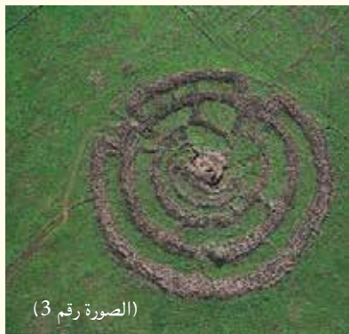
(الصورة رقم 3)

لا نعلم – حتى اليوم – ماهية استعمال الرُّجْم