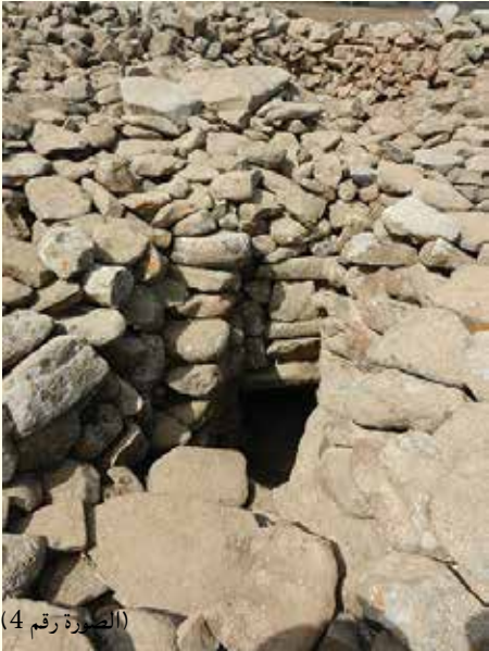
(الصورة رقم 4)

الدائري، إذ اختلف الباحثون فيما بينهم حول إمكانية استعماله معبدًا، أو موقعًا لدراسة الفلك والكواكب، أو مركزًا احتفاليًا أو مخزنًا كبيرًا. عام 2008 اقترحت بعثة من الجامعة العبرية أن تاريخ بناء الرُّجْم يعود إلى العصر النحاسي، حيث استعمل آنذاك موقعًا للعبادة لدى سكان جميع القرى التي كانت في الجولان حينها. ومما لا شك فيه أن العديد من الأسئلة لا تزال تنتظر الإجابات التي لا نعلم متى يمكن الحصول عليها من خلال البحث الأثري. إلا أن الموقع، حاليًا، متاح للزيارة، ويمكن للجميع الاستمتاع به وبالطبيعة من حوله، وأيضًا اقتراح آراء حول الموقع واستعماله.