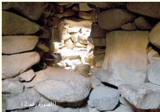
(الصورة رقم 2)

يتميز الجولان بالمواقع الأثرية المتنوعة من حيث ماهيتها وتاريخ نشأتها، إذ نجد الاستيطان القديم أو المعابد أو المباني المنفردة التي لا تزال بمثابة أحجية، لم يعثر الباحثون بعد على إجابة حول بنائها أو ماهية استعمالها. وأحد هذه المواقع المميزة هو رُّجْم الهري.