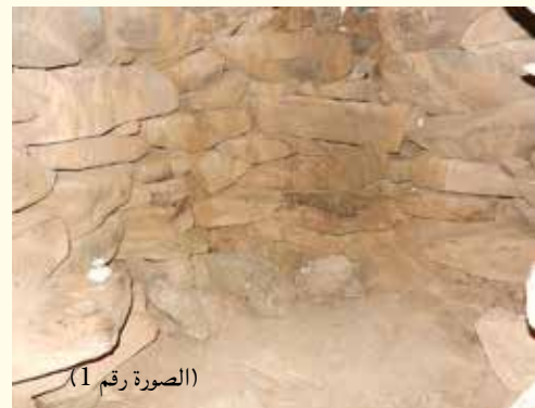
(الصورة رقم 1)

هو عبارة عن نُصْب مبني من الحجارة (الصورة رقم 1)، يقع في مركز الجولان الأدنى على بعد 16 كيلو مترًا إلى الشرق من الشاطئ الشمالي لبحيرة طبرية، في أعلى وادي الدالية، ويرتفع عن سطح البحر 515 مترًا. يتألف النصب من أكمة مركزية (أو رُّجْم) وتحيط به خمسة جدران متحدة المركز، ويبلغ قطر الجدار الخارجي حوالي 150 مترًا ويبلغ ارتفاعه مترين، تقريبًا. وتتصل الدوائر فيما بينها من خلال الممرات التي بُنيت من الحجارة وتتوسطها عدّة مداخل من جهات مختلفة، أي أنه ليس هناك مدخل واحد، بل عدّة مداخل لكل دائرة. وقد تمّ تحديد تاريخ النصب بالعصر البرونزي، قرابة 3,250 عامًا قبل الميلاد.