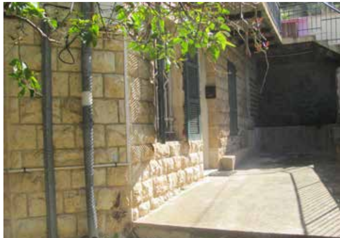
عتبة البيت من صبة الباطون