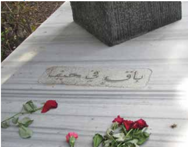
قبر إميل حبيبي - حُفر عليه "باق في حيفا"

في عام (1939) تزوّجت ندى من صادق عبود، وأنجبا أربع بنات وولداً واحداً. وعن زواجها تحدّثت قائلة: «كنت أرتل في جوقة ترتيل في «كنيسة مار