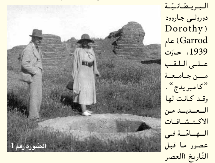
الصورة رقم 1

أما المرأة الأولى التي حازت على لقب بروفيسور في علم الآثار، كانت الباحثة