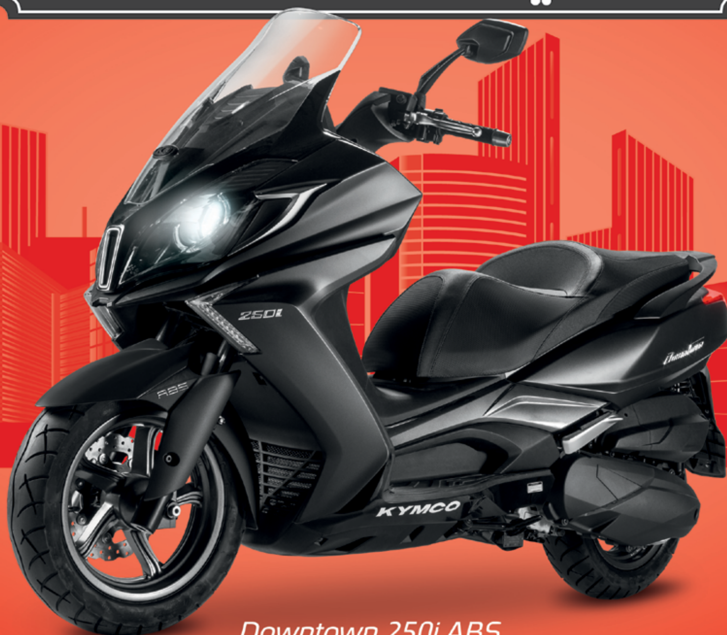
Downtown 250i ABS