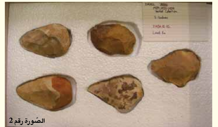
الصورة رقم 2

- جارتروود بل (Gertrude Margaret Bell 1868 - 1926) من أصل بريطاني. درست في جامعة "أوكسفورد" إلا أنها لم تحصل على اللقب الجامعي الكامل - جامعة "أوكسفورد" لم تمنح اللقب الجامعي للنساء حتى عام 1920. لدى بلوغها 24 من عمرها، سافرت إلى إيران وهناك درست اللغة الفارسية، وفي وقت لاحق درست، أيضاً، اللغة العربية. عملت في الأبحاث الأثرية في العراق. ومن أهم أعمالها إقامة متحف الآثار في العراق،