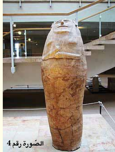
الصورة رقم 4

كاثلين كينيون Kathleen Kenyon (1906 - 1978)، من أصل بريطاني. كان والدها باحثاً للكتابات القديمة والتوراة. تعين عام 1909 مديراً للمتحف البريطاني في لندن. درست التاريخ والآثار في جامعة "أوكسفورد" وانضمت إلى جمعية "أوكسفورد" للآثار. في عام 1927، تم تعيينها رئيسة للجمعية، وكانت أول امرأة تتراأس جمعية "أوكسفورد" للآثار. تعتبر من أبرز الأثرية التي كانت لها اكتشافات هامة، أبرزها في تل أريحا، فهناك كشفت حضارة الإنسان القديم خلال العصر الحجري الأخير، كما أنها أدارت حفريات هامة في السامرة والقدس (حي سلوان).