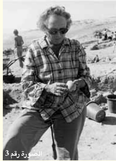
الصورة رقم 3

- ماري ليكي Mary Leakey، واحدة من أبرز النساء الأثرية (1913 - 1996)، من أصل بريطاني. عاشت ماري في طفولتها مع والدها الذي كان رسّاماً، ومنذ صغرها عاشت في بيئة مليئة بالتحف الأثرية وبين المتاحف. بدأت دراسة الآثار عام 1930 وفي عام 1933 شاركت في الحفريات الأثرية في إفريقيا. في عام 1960 تم تعيينها مديرة لبعثة الحفريات في تانزانيا التي كانت قد بدأتها مع زوجها. كانت لها خلال تلك الحفريات اكتشافات هامة حول الإنسان القديم؛ ففي عام 1959 عثرت على فك تعود لجمجمة الإنسان القديم المسمى "بارانثروبوس بويزي" (Paranthropus boisei)، وهو نمط من الإنسان البدائي جداً، عاش في إفريقيا قبل قرابة 2.6 مليون عام، ومنه تطور الإنسان المستقيم القادمة. تجدر الإشارة إلى أن الباحثة ماري ليكي، لم تنه تعليمها الجامعي على الإطلاق، ورغم ذلك فقد كانت اكتشافاتها من أهم الاكتشافات الأثرية على الصعيد العالمي، وقد حازت على جوائز تقديرية، بسبب تلك الاكتشافات والأبحاث التي قامت بها.