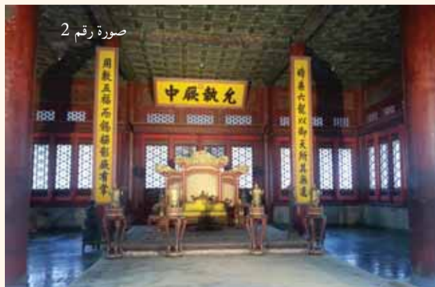
صورة رقم 2

للـقصر). ويعتبر القصر في أيامنا أكبر قصر قديم في العالم والذي يمثّل قمّة الفن المعماري الصيني القديم. في عام 1989، أعلنت عنه منظمة اليونسكو الدّولية موقعاً تراثياً عالمياً. بدأ بناء القصر عام 1406 واستمرّ بناؤه قرابة 14 عاماً، لتنتهي بذلك عمليّة البناء عام 1420.