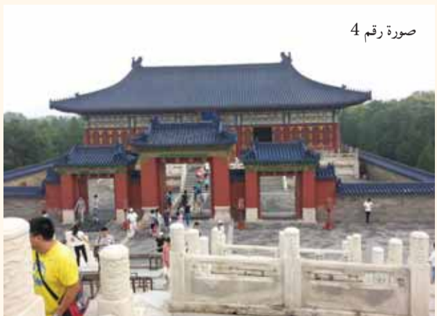
صورة رقم 4

كان المعبد مكان صلاة القياصرة من سلالة "مينغ" و"تشونغ" (الصورة رقم 3). يعتبر المعبد واحد من أبرز المواقع السياحيّة في بكين، وهو بدوره مبنّى من الخشب من دون استخدام معادن أو مواد بناء أخرى فيه على الإطلاق. بُني المعبد بين الأعوام 1406 - 1420 في جنوب المدينة ويشمل عدّة مبان: المعبد "معبد الجنّة"، ويسمّى أيضاً "معبد السّماء"، المذبح وقاعة الصّلاة (الصورة رقم 4) التي كانت تستعمل للصّلاة طلباً من الآلهة بتوفير محاصيل زراعيّة غنيّة وجيدة. إنّ المعبد دائري الشكل، مبنّى من ثلاثة طوابق. خلال العصور القديمة، تمّ طلاء المعبد بثلاثة ألوان: الطابق الأرضي طلي باللون الأخضر، رمزاً لعامة الشعب والحياة على الأرض، أما الطابق الثاني فتّم طلاؤه باللون الذهبي وهو لون القياصرة الذين يشكّلون وفقاً للحضارة الصينيّة، حلقة الوصل ما بين الإنسان والآلهة. والطابق الثالث الذي يرمز إلى الآلهة، فتّم طلاؤه باللون الأزرق وهو لون السّماء.