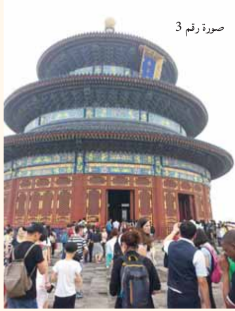
صورة رقم 3

كانت المدينة المحرّمة مسكن القياصرة منذ العام 1368 وحتى العام 1911 وقد سمّيت المدينة المحرّمة، لأنها كانت ممنوعة لدخول الزوّار أو الخروج منها إلا بإذن القيصر، إذ سكنها فقط القيصر وحاشيته. اعتبر القيصر في العصور القديمة، على أنه ممثّل الآلهة على الأرض. من هنا، بُنيت المدينة وفقاً لما اعتقده الصينيون آنذاك، بأن يكون شكل مدينة القيصر في الجنّة. جميع مباني المدينة المحرّمة مبنية من الخشب. هذا الأمر فرض على المهندسين والمعماريين الأخذ بعين الاعتبار إمكانية الحرائق التي من شأنها أن تمحو جميع المباني بسهولة. من هنا، تمّ تخطيط المدينة بشكل يميّز، يمكنه الصمود بشكل معيّن أمام النيران في حال اندلاعها.