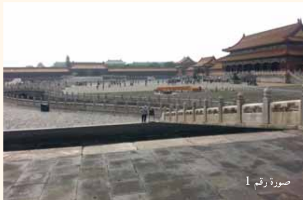
صورة رقم 1

هي عبارة عن مجمع مبان، تشكّل القصر الملكي الذي تواجد فيه القيصر يومياً لإدارة شؤون المملكة (الصورة رقم 1 - ساحة أماميّة