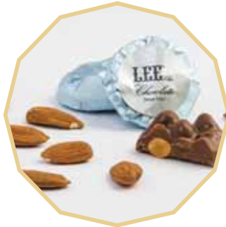
شوكولاتي محشوة باللوز