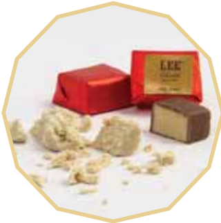
شوكولاتي محشوة بالحلوة