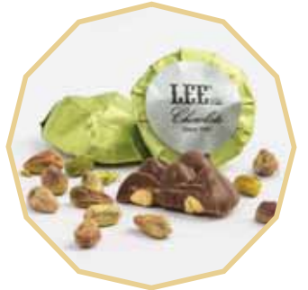
شوكولاتي محشوة بالفستق الحلبي

محشوة بالمكسرات الكاملة حبة بحبة... والمزيد المزيد من الطعمات الغنية