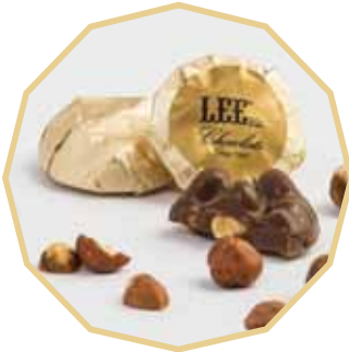
شوكولاتي محشوة بالبندق