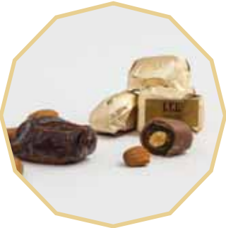
شوكولاتي مرة محشوة بالتمر واللوز